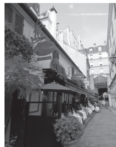
パリで最も古いカフェ「ル・プロコップ」