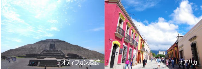
テオティワカン遺跡