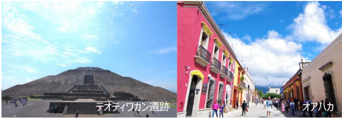
テオティワカン遺跡