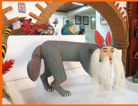
コヨーテに変身したナワル（シャーマン）の木彫