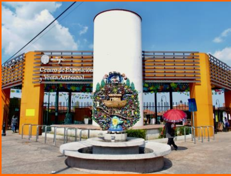
メヒコ州メテベックの民芸品市場